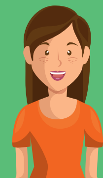
Quyền lợi của Mẹ