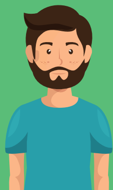
Quyền lợi của Bố