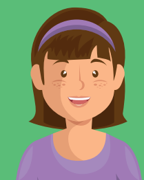
Quyền lợi của Con gái